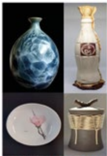
XLIII FERIA CERAMICA DE PONFERRADA del 5 al 9 de Septiembre 2024

Por la tarde, a las 21 h.- Clausura de la XLIII Feria de Cerámica y de Embarrarte2024.