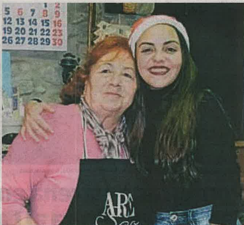
Detrás de la barra, la galardonada, con parte de su familia.