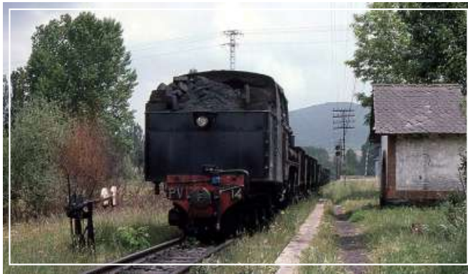
Fot.1: Fotografía de Wilson Lythgoe publicada en la web internationalsteam.co.uk , en la que aparece el desaparecido apeadero de Columbrianos. Se aprecia al fondo una señal luminosa de dos focos tipo Adaro, avanzada de San Andrés de Montejos, y la barrera del paso a nivel de la carretera de Villablino.