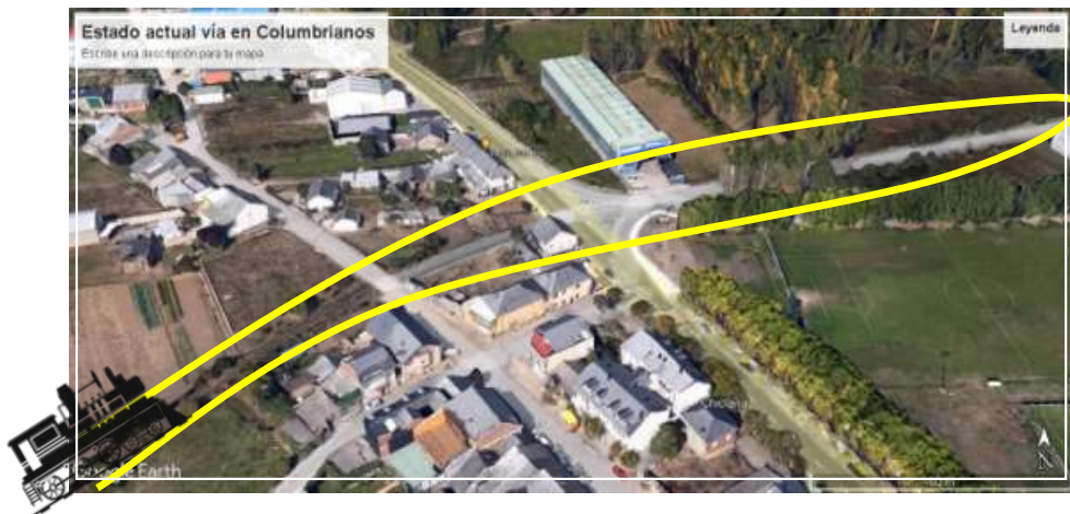
Fot.2: Fotografía que muestra el estado actual de la zona. Izq.: tramo con vestigios de la antigua vía ferroviaria; dcha.: intersección y calle pavimentada para la que se propone la denominación El Apeadero, sobrepuesta a un tramo de la antigua vía.