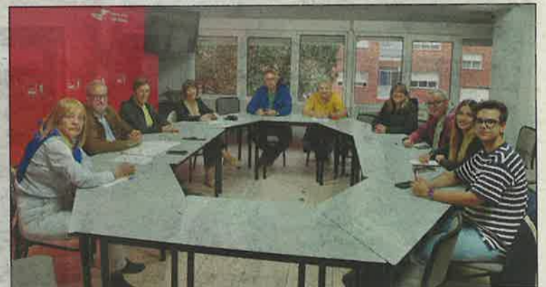
Imagen de la Ejecutiva socialista de Ponferrada emitida por el PSOE.

En la reunión valoraron el Pleno Ordinario de Ponferrada que se celebró el pasado 5 de septiembre. «Lo que el actual alcalde había calificado como un superpleno por la cantidad de puntos que pretendían aprobar se convirtió en un superpleno por la cantidad de puntos que tuvo que dejar sobre la mesa», dicen los socialistas.