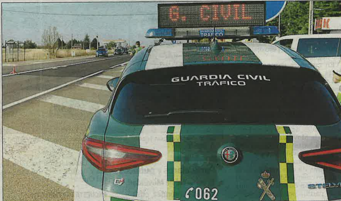
La droga fue incautada en un control de Tráfico, en Toral de los Vados. MARCIANO PÉREZ

En su interior había una toalla de color verde que envolvía un paquete rectangular de color negro con unas medidas de 15x20x4 centímetros, con un peso aproximado de un kilo.