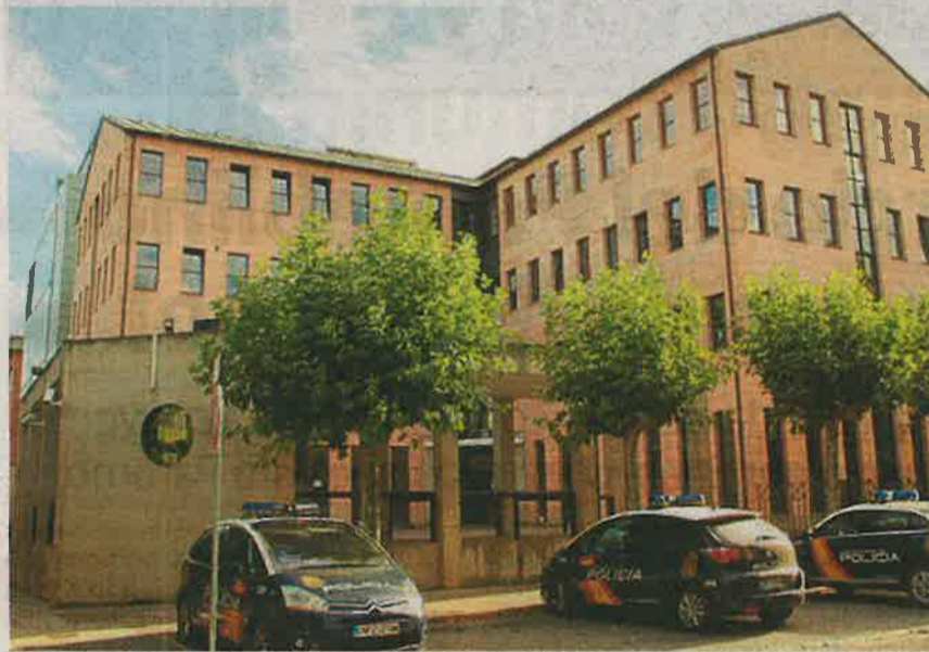
La operación fue desarrollada por la Policía Nacional.

La investigación determinó la autoría de los hechos por parte de los detenidos, a los que se les pudo ubicar en el lugar y hora de los mismos y comprobar fehacien-