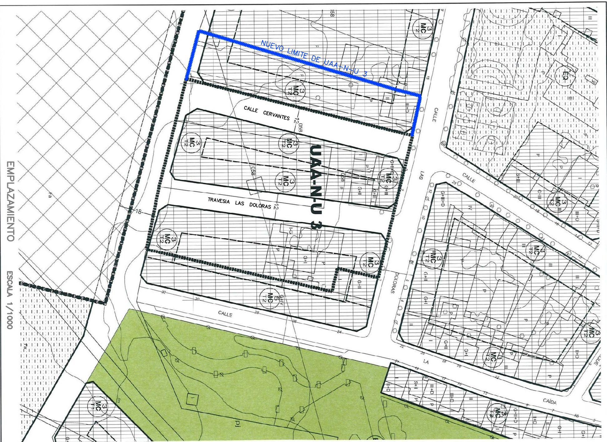
EMPLAZAMIENTO ESCALA 1/1000