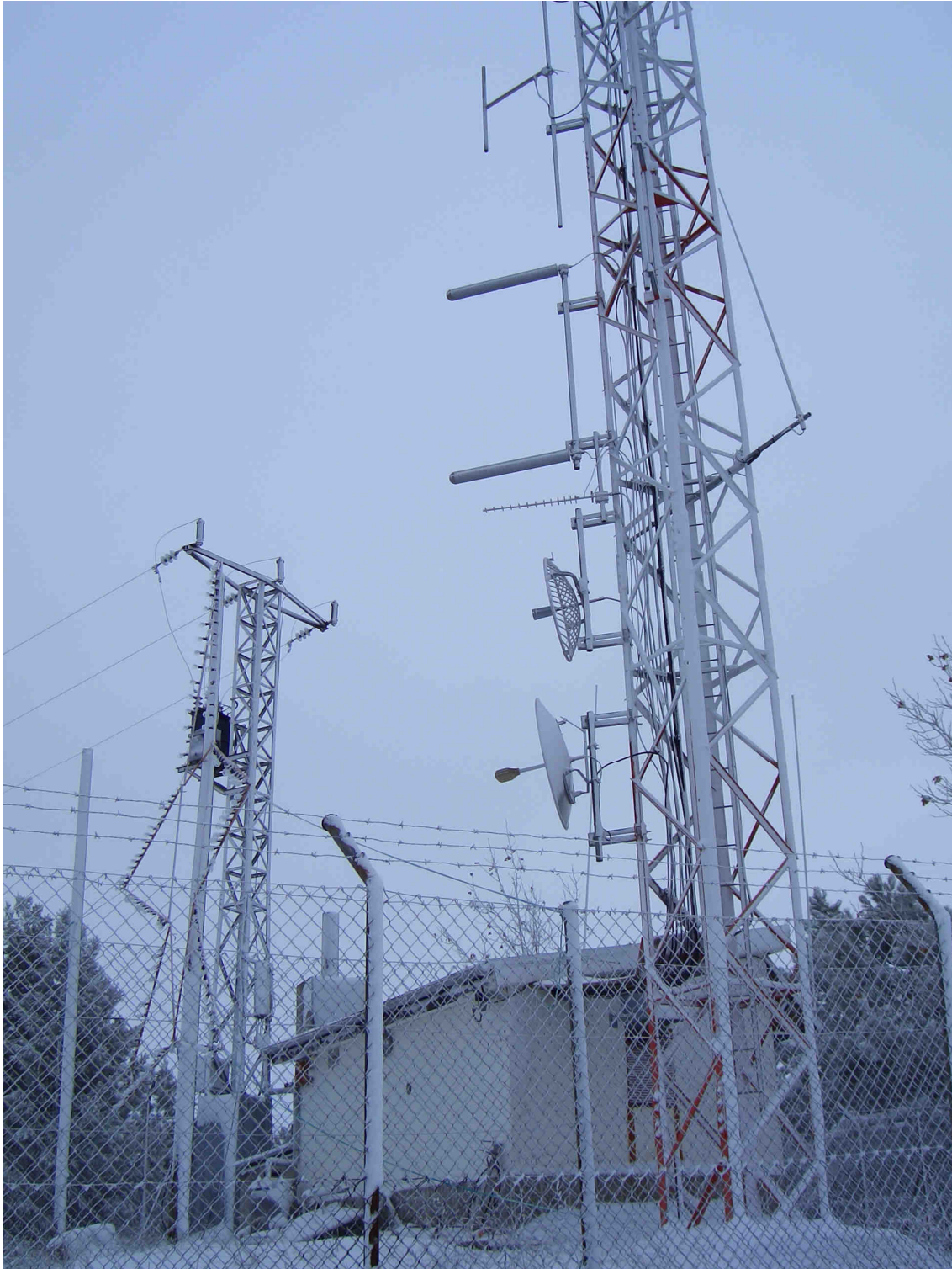
Imagen de las infraestructuras existentes en la cima del monte Pajariel destinadas a la instalación de la BS.