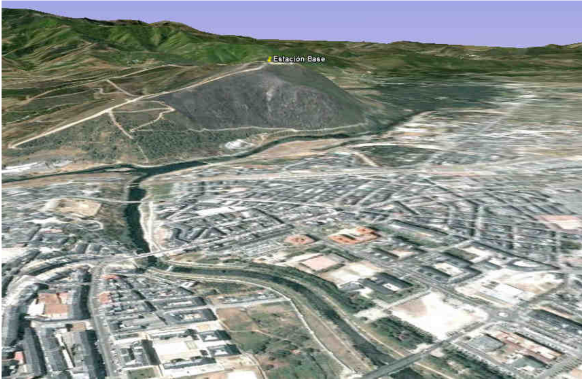
Vista en Google Earth de la ubicación de la BS