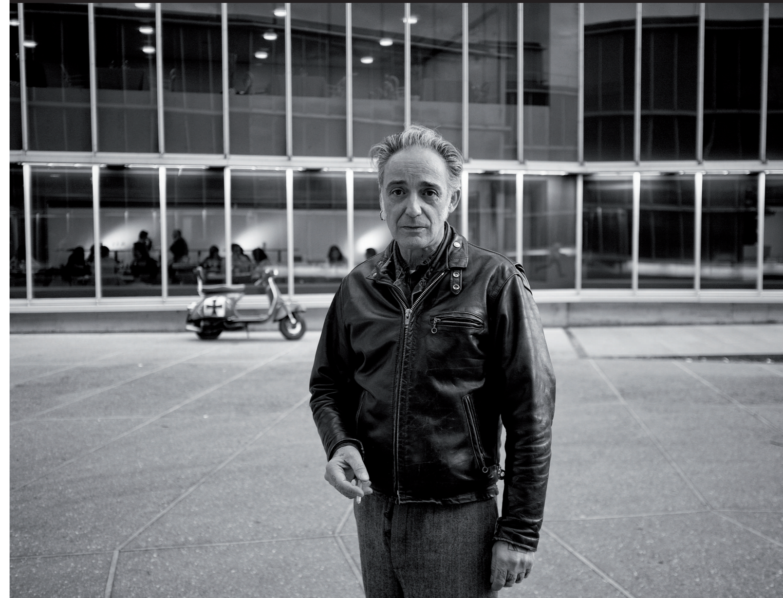
Alberto García-Alix (2012)