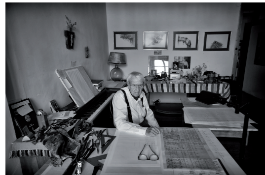
Cristóbal Halffter (2016)