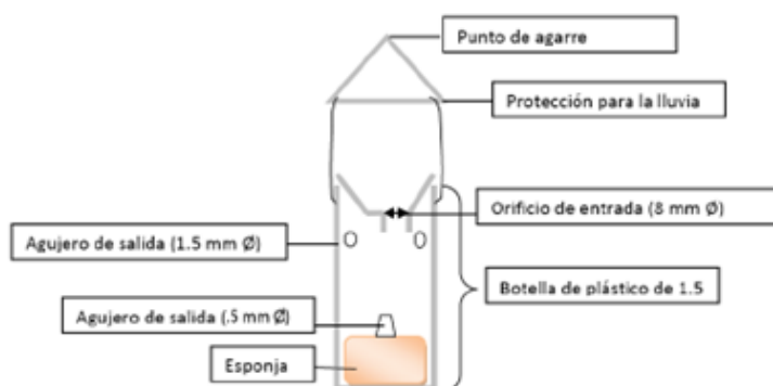
Figura 2. Adaptación de la trampa de embudo propuesta por Monceau et al. (2012). Estrategia de Gestión, Control y Posible Erradicación del Avispón asiático o Avispa negra ( Vespa velutina ssp. nigrithorax ) en España

Para aumentar la efectividad de la trampa el diámetro del orificio de entrada de los insectos deberá limitarse a 8 mm, y para que los insectos no de pequeño tamaño puedan salir fácilmente el atrayente se colocará impregnado en una esponja y la trampa deberá tener orificios de salida de diámetro de 5 mm en la parte inferior a la altura de enrase del líquido atrayente, y orificios de salida de 1,5 mm uniformemente distribuidos por toda la superficie de la trampa.