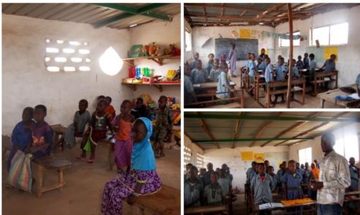
Distintas clases del complejo escolar Samba Chargie Lower en el distrito de Kerewan