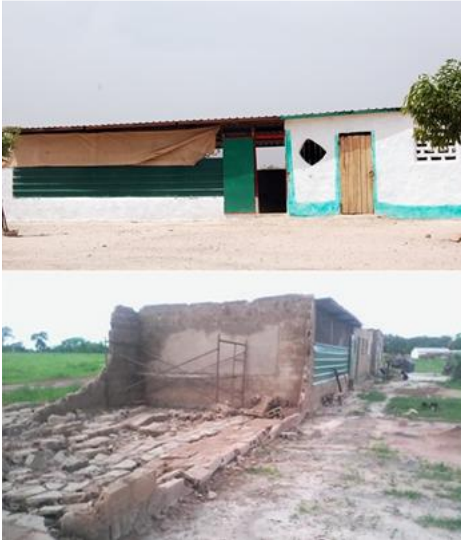
Estado de una de las aulas antes y después del huracán del 13 de Agosto de 2015

Durante la época de Tormentas tropicales del pasado año 2015, un huracán derrumbó las infraestructuras de una de las 6 aulas de Samba Charge Lower en Kerewan a la que asistían parte de los 203 niños escolarizados. Por lo que Cooperación Bierzo Solidario considera prioritario la rehabilitación de las infraestructuras y la mejora de las mismas, para contribuir a facilitar la transformación de la vida de los más pequeños a través de la educación.