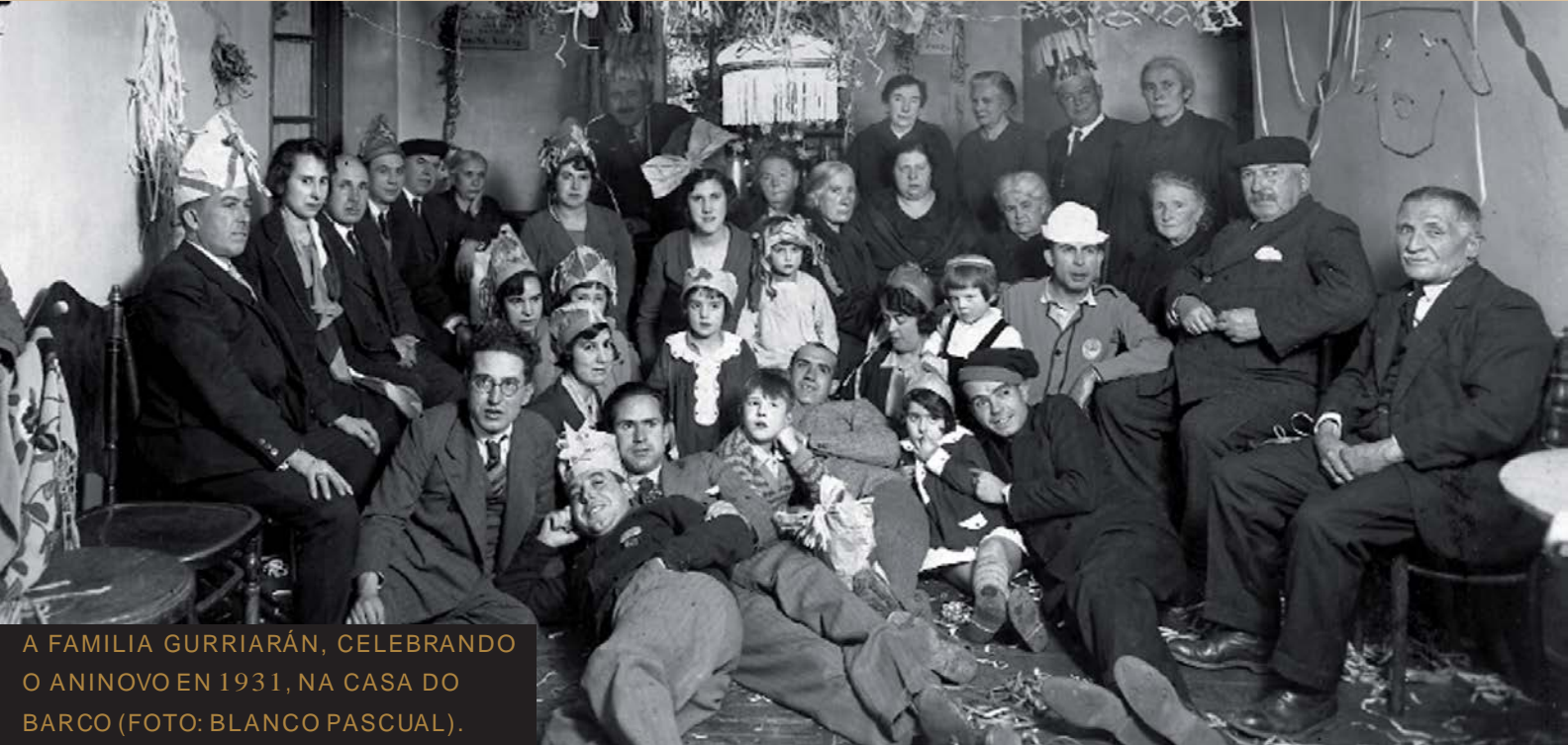
A FAMILIA GURRIARÁN, CELEBRANDO O ANINOVO EN 1931, NA CASA DO BARCO.