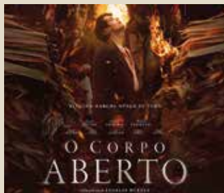
Cuerpo abierto (Ángeles Huerta, 2022)