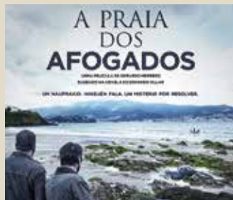
La playa de los ahogados (Gerardo Herrero, 2015)