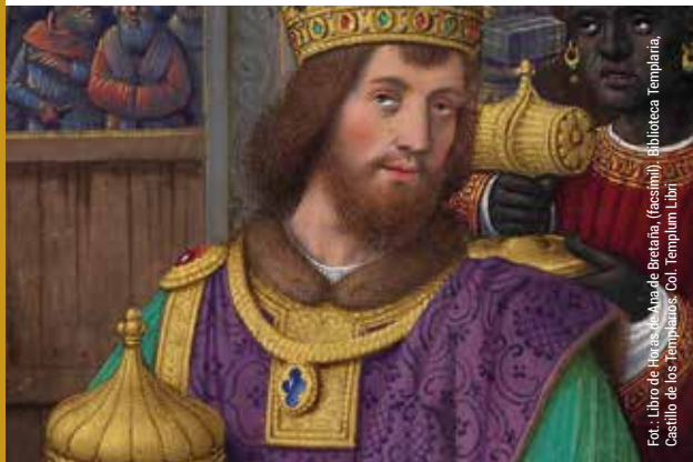
Fot.: Libro de Horas de Ana de Bretaña, (facsimil). Biblioteca Templaria, Castillo de los Templarios. Col. Templum Libri