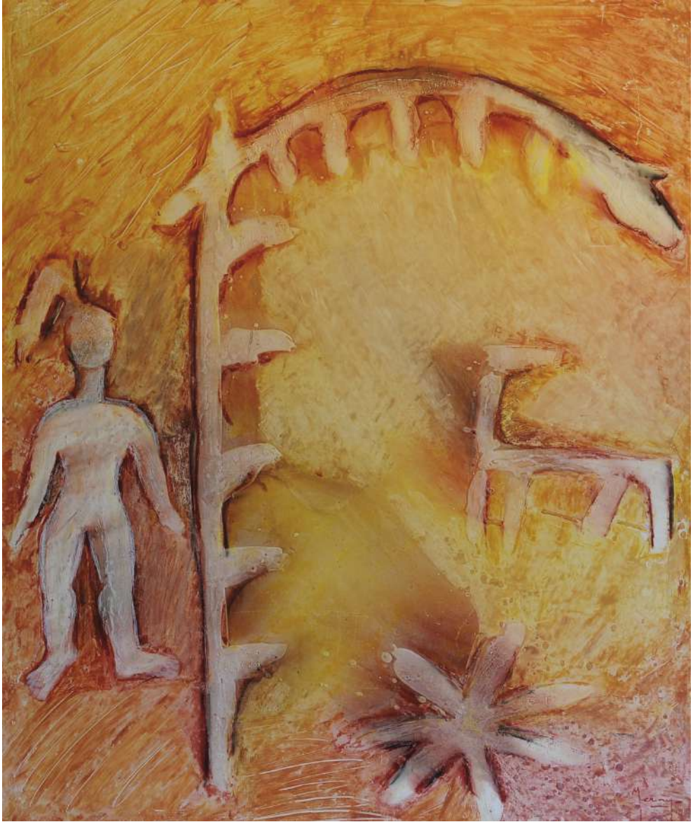
Figura en ocre

Ceras y téc. mixta / cartoncillo folding 116 x 98 cm