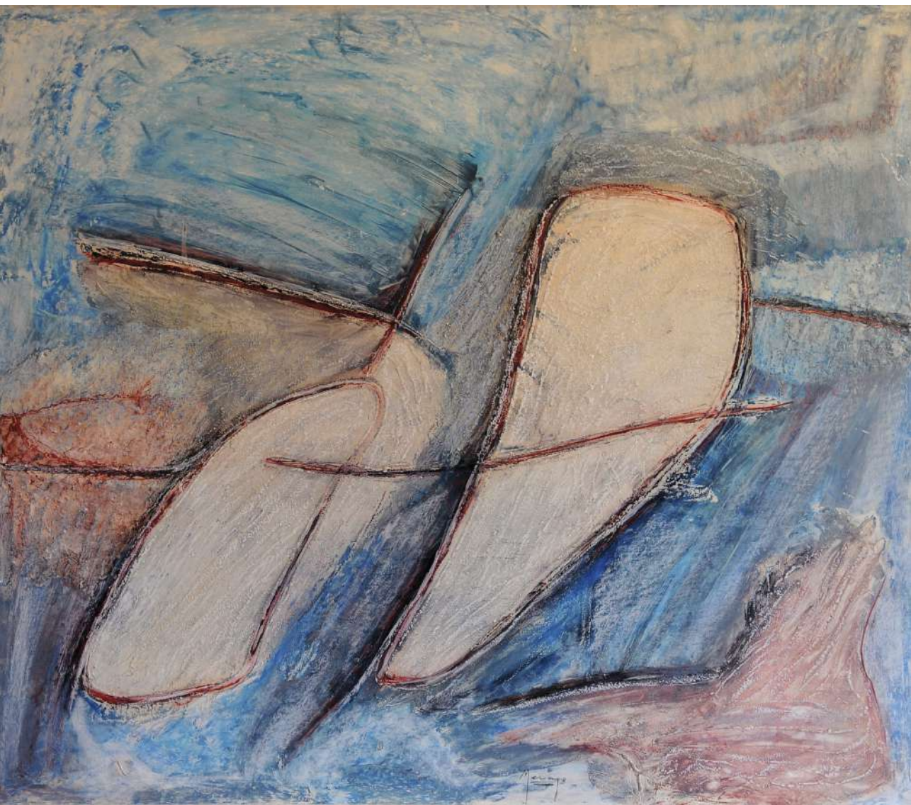
Figura en azul

Ceras y téc. mixta / cartoncillo folding 98 x 116 cm