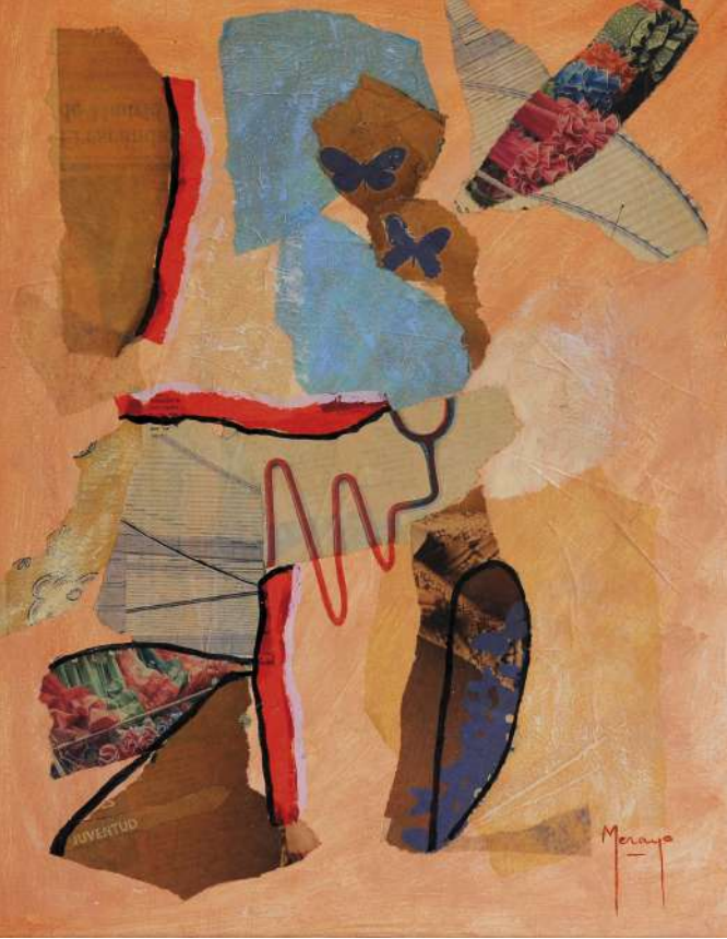
Primavera Collage / tela 50 x 40 cm