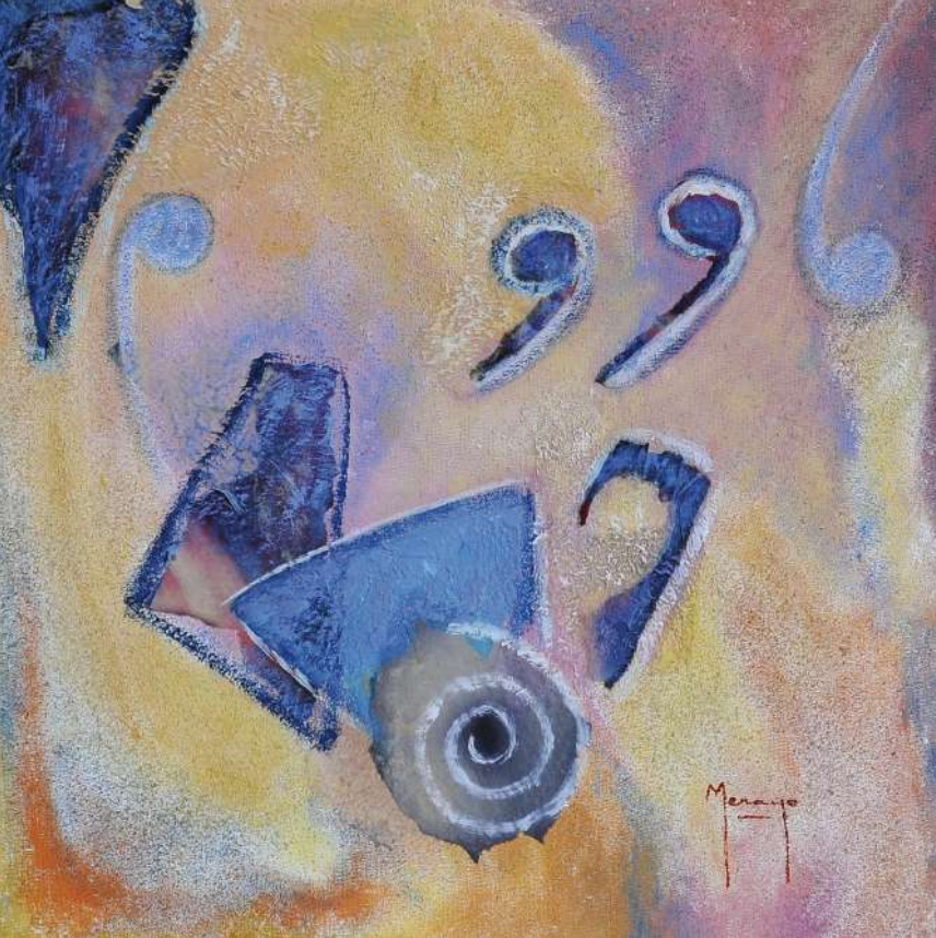
Cantata Collage / tela 40 x 40 cm