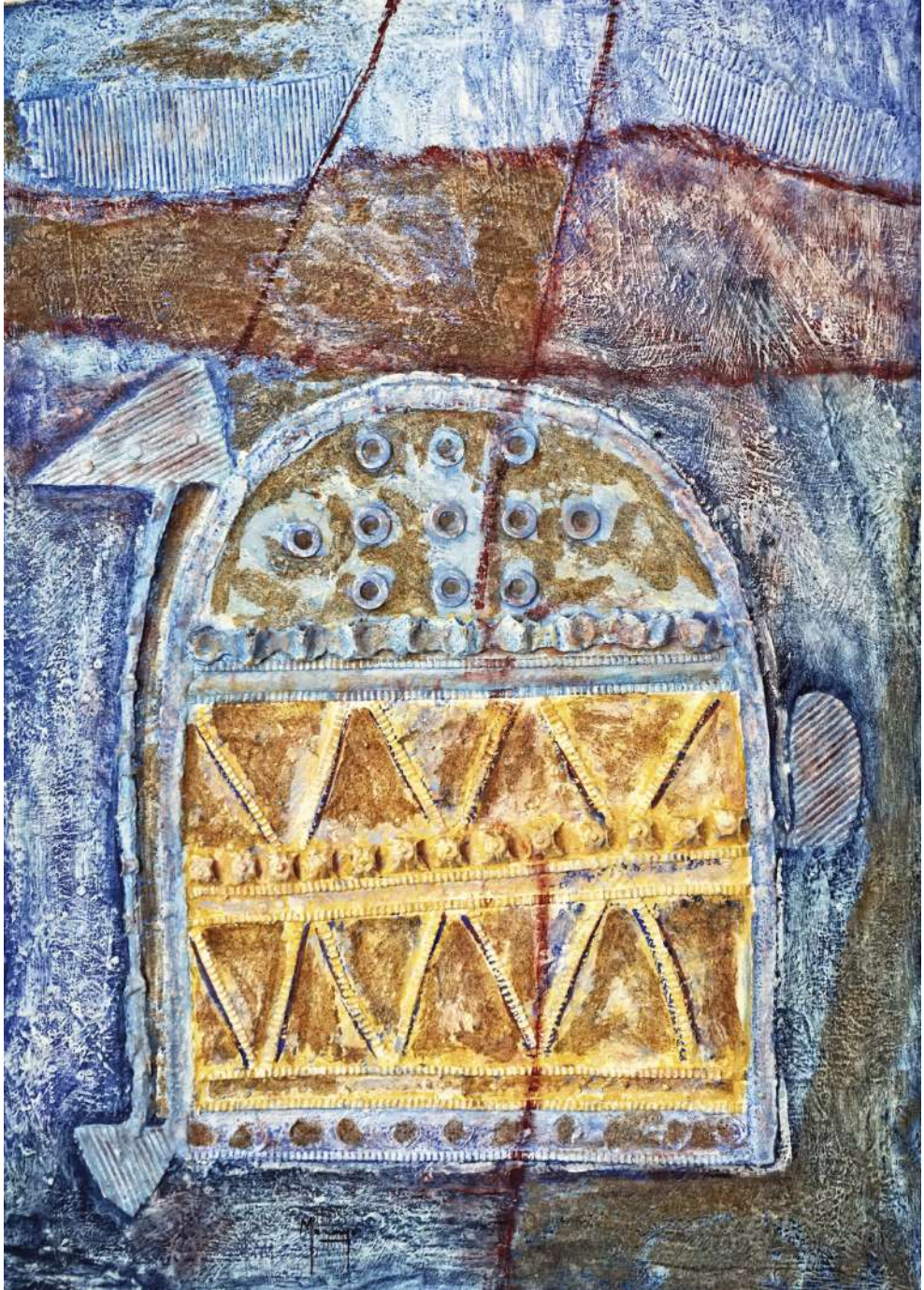
Estela de Tabuyo Collage y mixta / cartón artesano 119 x 86 cm