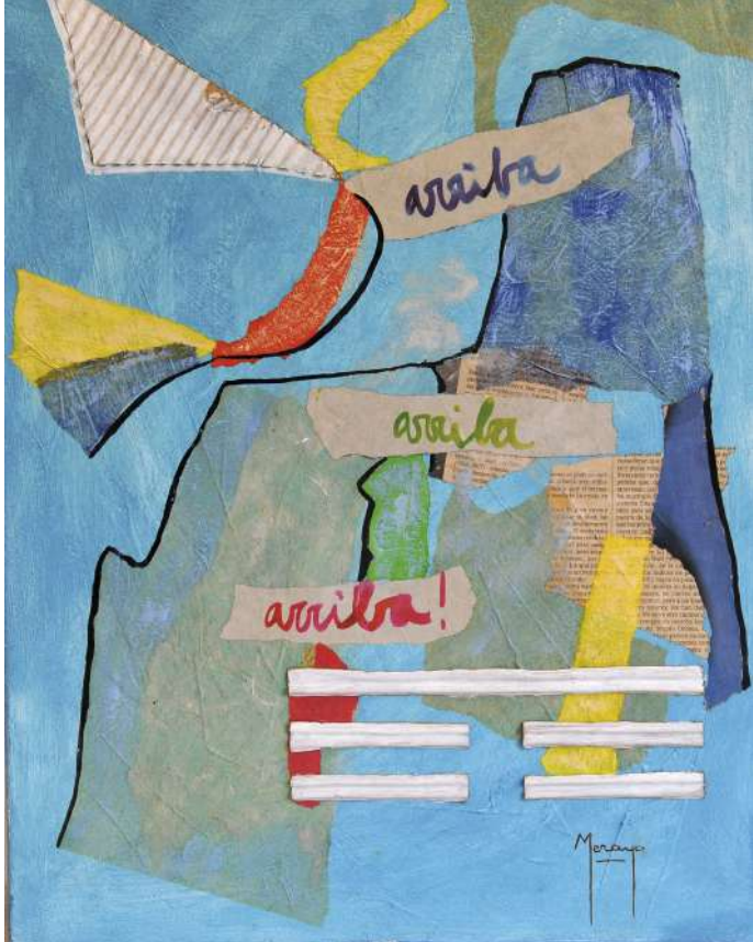
Invierno Collage / tela 50 x 40 cm