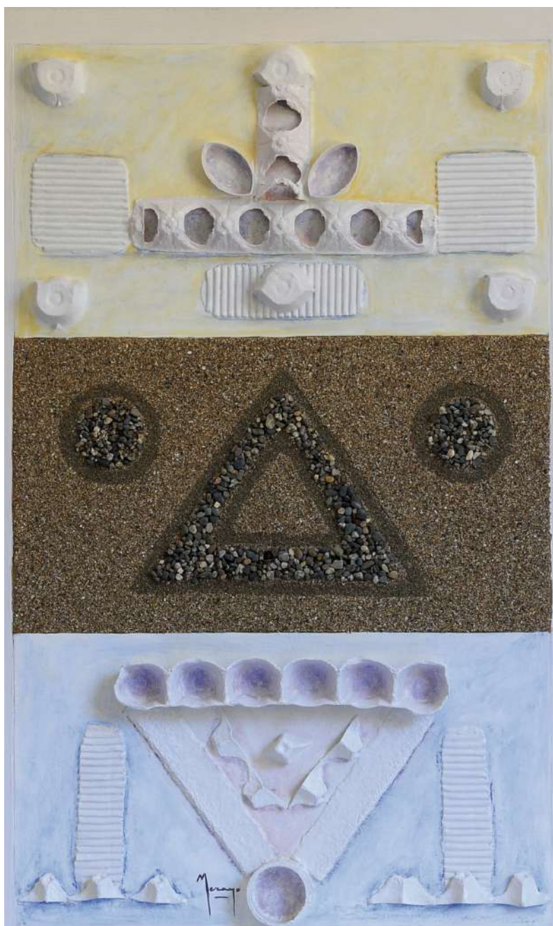
Huellas II Collage / tabla 82 x 52,5 cm