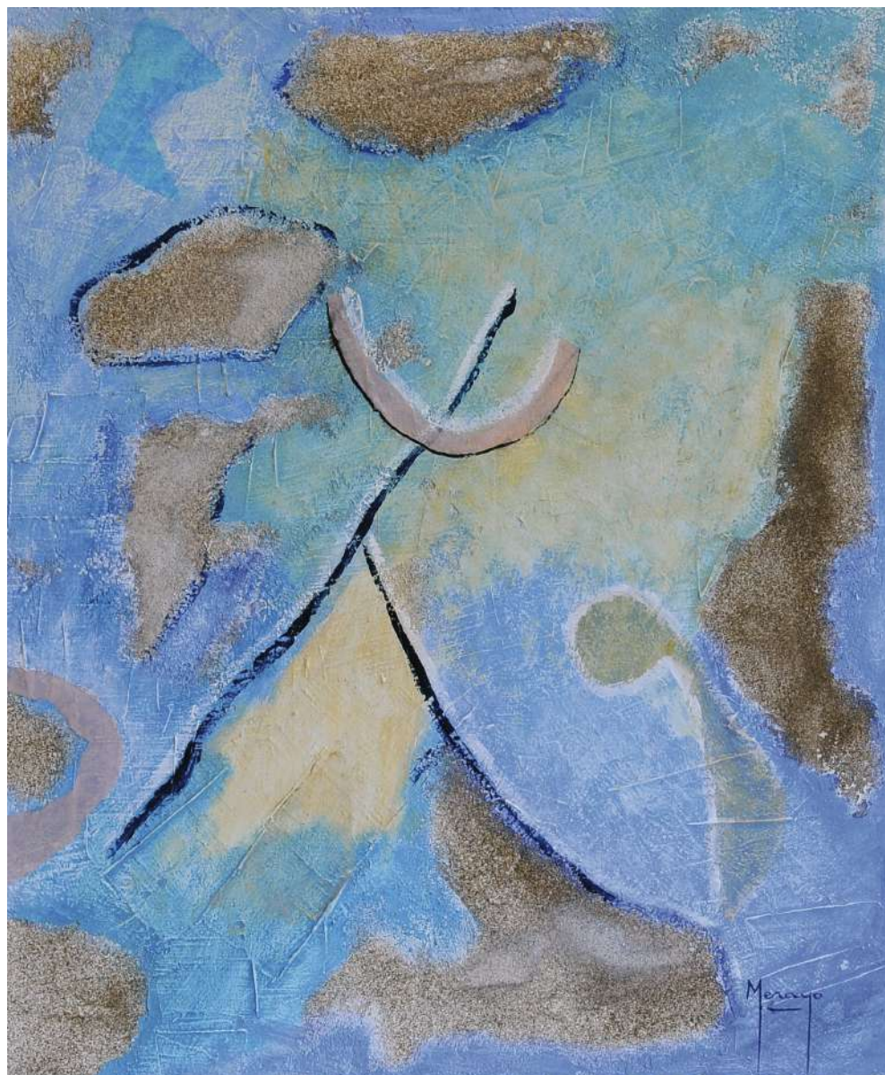
Rondó Collage / tela 55 x 45 cm