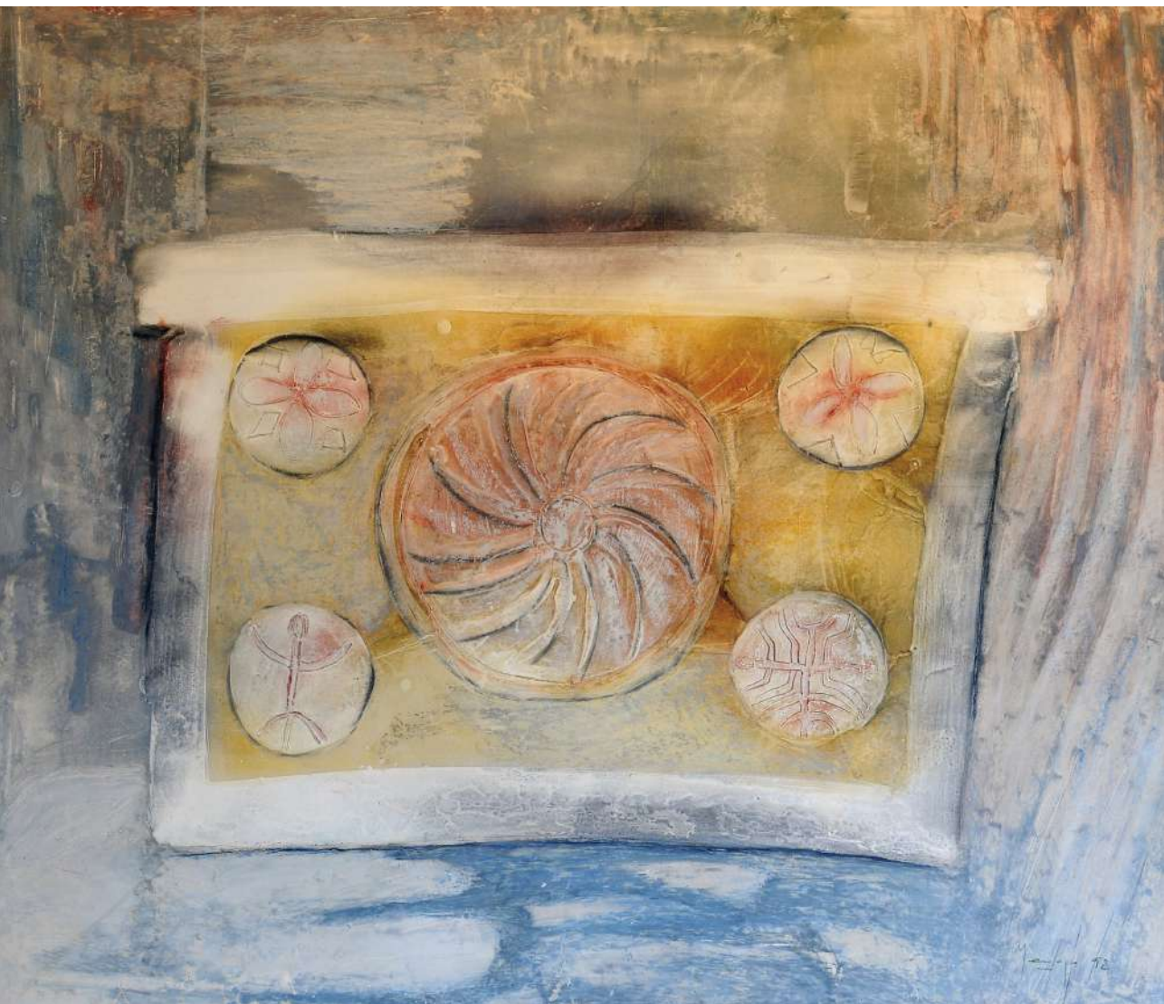
Santa María de Lebeña Ceras y téc. mixta / cartoncillo folding 98 x 116 cm