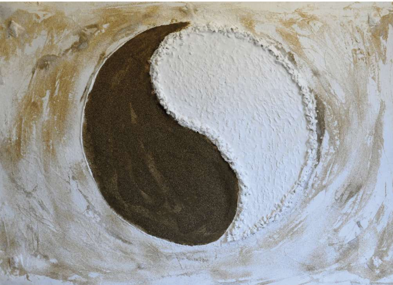
El Yin y el Yang Téc. mixta / cartón artesano 81 x 114 cm