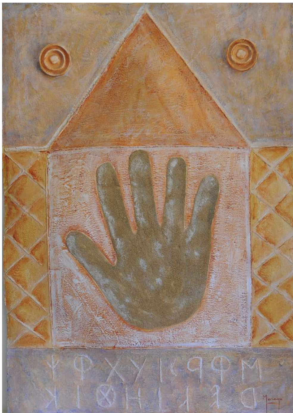
Estela de la mano Téc. mixta / cartón artesano 116 x 76 cm