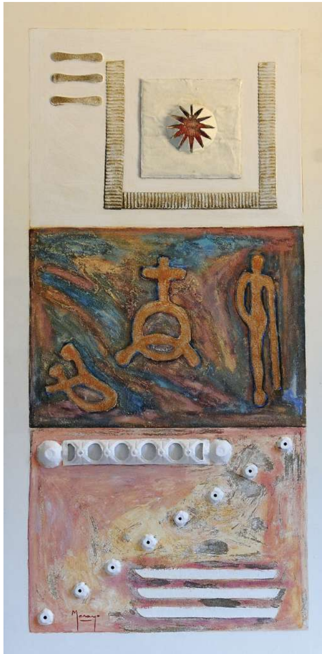
Huellas III Collage / tabla 120 x 60 cm