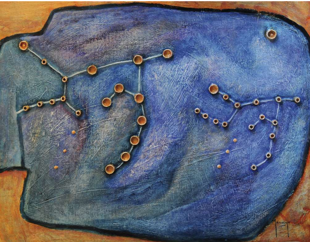
Danza Pedrafitas dels bufadors Collage y mixta / cartón artesano 84 x 116 cm