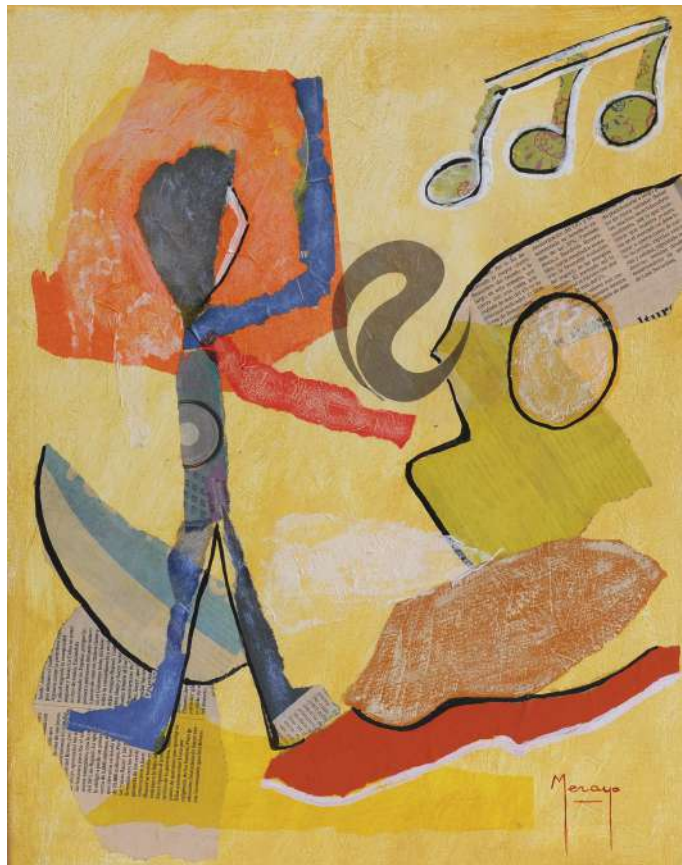
Verano Collage / tela 50 x 40 cm