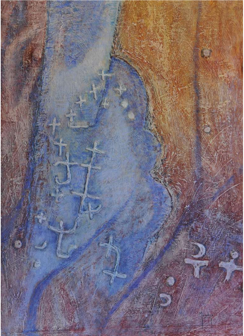
Piedra del Puig Alt Téc. mixta / cartón artesano 116 x 84 cm