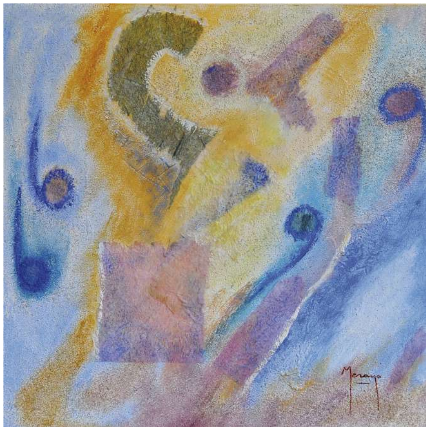
Cantata Collage / tela 40 x 40 cm