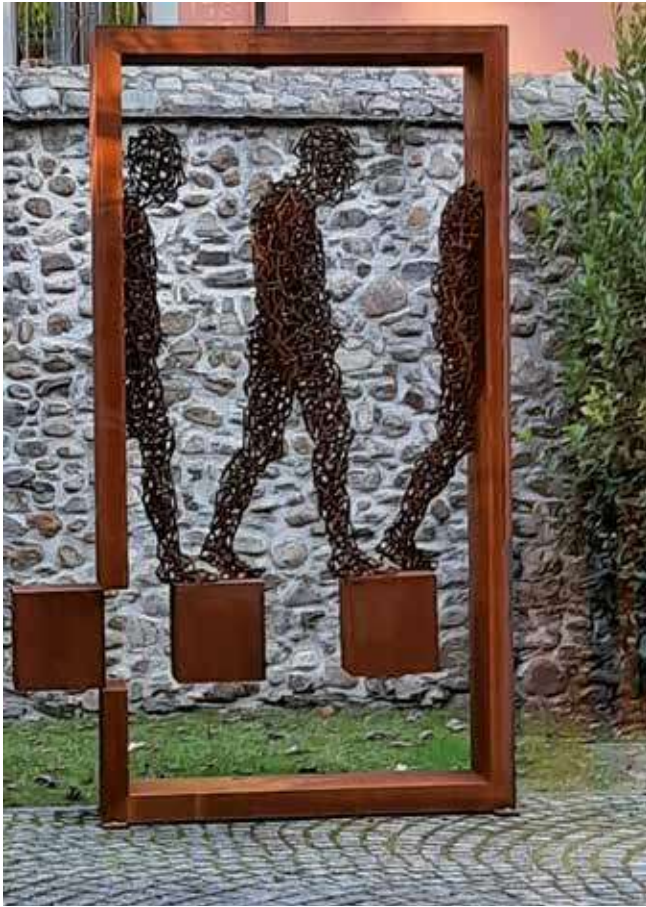
▲ Escultura realizada por: Amancio González Andrés

9 de SEPTIEMBRE (viernes) Cerrarán los talleres de Embarrarte y las demostraciones de técnicas cerámicas. A las 21 horas se clausurará la XLI Feria de Cerámica y Embarrarte2022 .